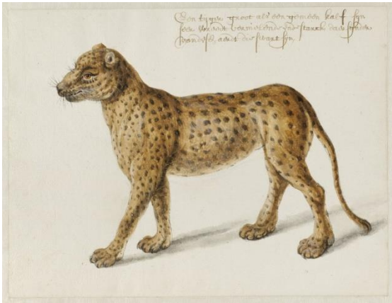
Jaguar: "Seer wreedt, vernielende ende starck"

In 1597 kwamen de schepen terug van 'de eerste schipvaart' naar o.a. Bantam. Zij brachten ook een exotische vogel mee.