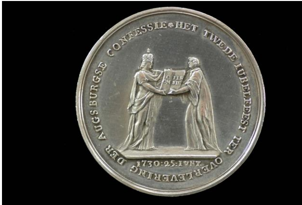
'Luther biedt de Augsburgse Confessie aan de keizer aan', voorzijde gedenkpenning, Willem de Wijs (1730), zilver diameter 46 mm, foto: Carel van den Berg.

Op de afgebeelde voorzijde overhandigt Luther de Augsburgse Confessie aan keizer Karel. Op de tweede foto ziet u nog een ander voorbeeld uit 1930, het 4 e eeuwfeest van de Augsburgse Confessie, eveneens uit de collectie van Donga en Van den Berg. 1