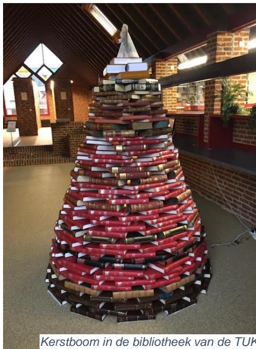
Kerstboom in de bibliotheek van de TUK