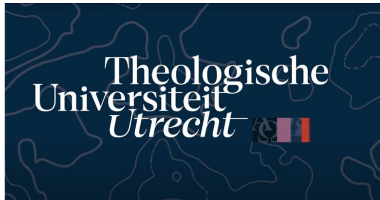
De nieuwe huisstijl van de Theologische Universiteit Utrecht