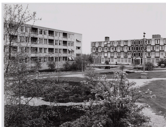
Het Maarten Lutherhuis in Osdorp, met in de tuin het carillon met de lutherse zwaan