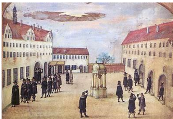
De Universiteit van Wittenberg aan het begin van de 16e eeuw