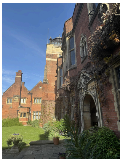
Westminster College, Cambridge

Haar lezing had de titel: 'Networking to survive: Mapping the networks of Early Modern Dutch Lutheranism' (Netwerken om te overleven: de netwerken van het vroegmoderne Nederlandse lutheranisme in kaart gebracht).