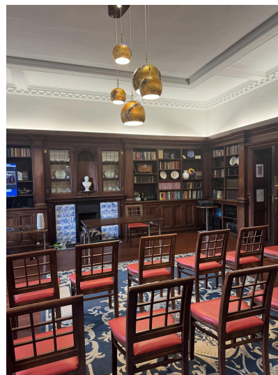
The Assembly Room, Westminster College

Prof. Hiebsch liet aan de hand van een aantal voorbeelden rond de thema's bescherming, geld en predikanten zien hoe belangrijk internationale netwerken waren voor de Nederlandse lutheranen en hoe zij die opbouwden en gebruikten om hun plaats op de religieuze kaart van de Nederlanden te veroveren en uit te bouwen.