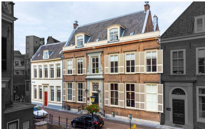
Het tweede gebouw van de TUU in Utrecht, Kromme Nieuwegracht 4-6.